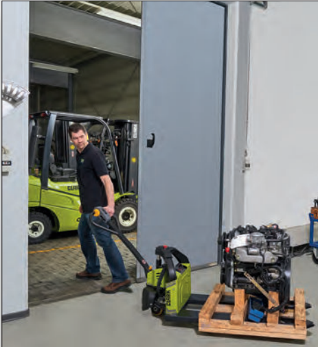
Optimal für den Einsatz in der Industrie